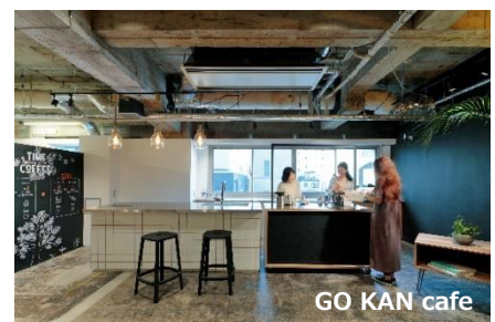
GO KAN cafe

リストグループでは、不動産業界と相性が良いテクノロジー企業や最先端企業とのコネクションを構築し、グループ内における新規事業の創出及び不動産業界の発展に繋がります。