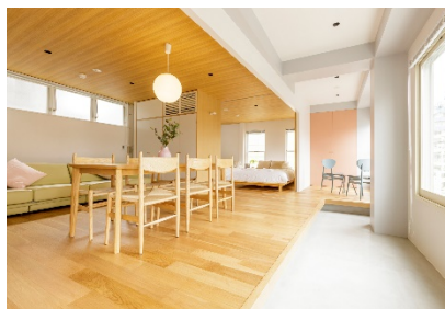
【3F】“縁側”をコンセプトに、大きな縁側を設けて外と内の境を曖昧な空間を作ることで開放的で広々とした客室