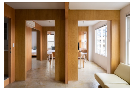
【4F】“続き間”をコンセプトに、柱型の間仕切りによって小さな空間が連なっており、空間にフレキシビリティがある

リ・ワンス渋谷は、リストプロパティーズにて2019年9月に築15年の松濤ビル(事務所・店舗用途)を取得後、2018年6月の旅館業法改正※1、2019年6月の建築基準法改正※2を活用して2~4階部分をホテルにコンバージョンし、2020年6月にオープンいたしました。