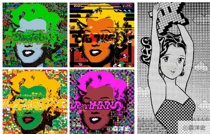
※上記写真はイメージとなります。作品は急遽変更となる可能性があります。