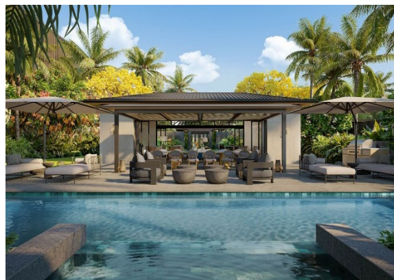
コートヤードイメージ