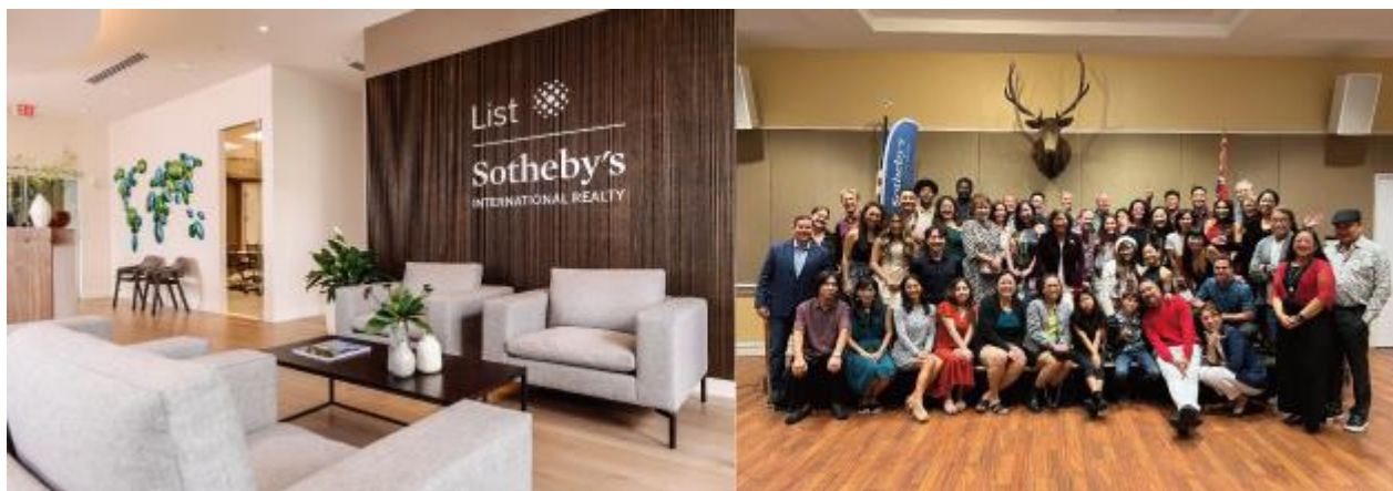
左：リスト サザビーズ インターナショナル リアルティ カカアコオフィス