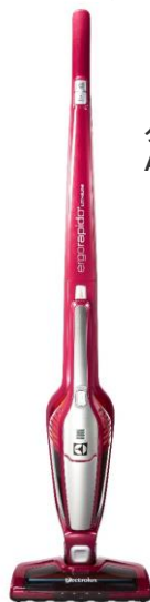
【スティック掃除機】 エレクトロラックス エルゴラピード・リチウム