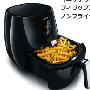
【キッチン家電】 フィリップス ノンフライヤープラス