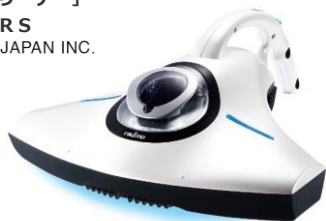
【ふとんクリーナー】 レイコップRS