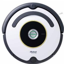
【ロボット掃除機】 アイロボット ルンバ 622