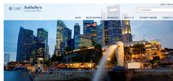
新設ホームページ