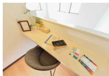
※画像はリストガーデンシリーズの外観とワークスペース一例