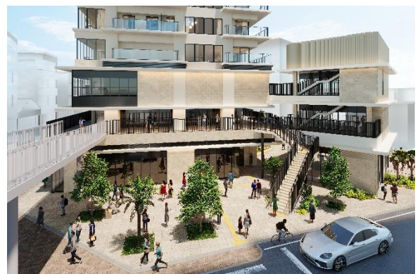
※外観エントランス完成予想 CG

本建物内には、高層棟の5~29階部分に総戸数196戸の分譲マンション、高層棟1~3階部分および低層棟には商業施設が建設されます。居住者様に必要とされる生活環境を整備し、利便性の高い暮らしを提供します。