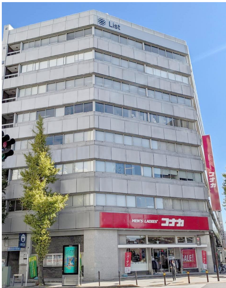
LIST EAST BLD. 写真

移転先の LIST EAST BLD.にはグループ会社も入居し業務を行っており、グループ間での業務効率向上が見込めること、また今後の更なる事業拡大のため移転することになりました。