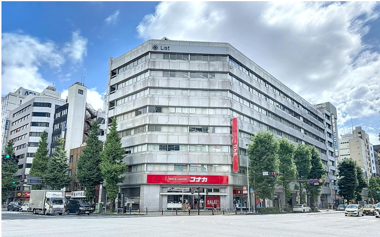
LIST EAST BLD. 写真

総合不動産企業、リスト株式会社（代表取締役社長：北見尚之、本社所在地：神奈川県横浜市）は、2024年9月1日付で本社をLIST EAST BLD.へ移転します。