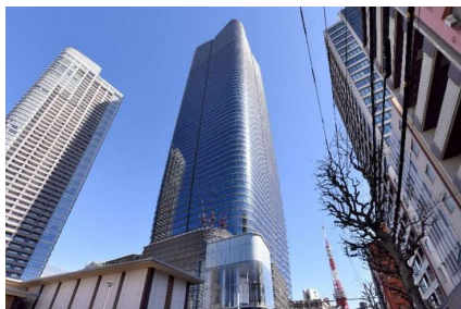
物件名：アマンレジデンス東京 所在地：東京都港区