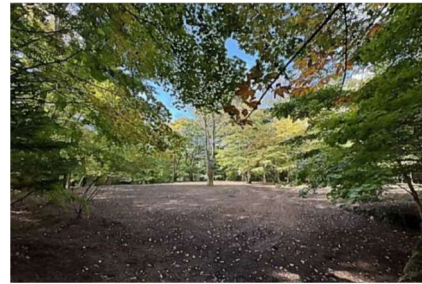
物件名：軽井沢土地 所在地：長野県北佐久郡 成約金額：10億円前後