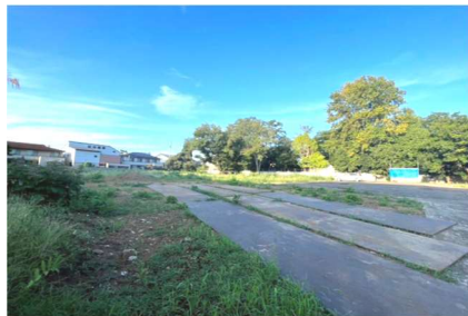
物件名：深沢土地 所在地：東京都世田谷区 成約金額：45億円前後